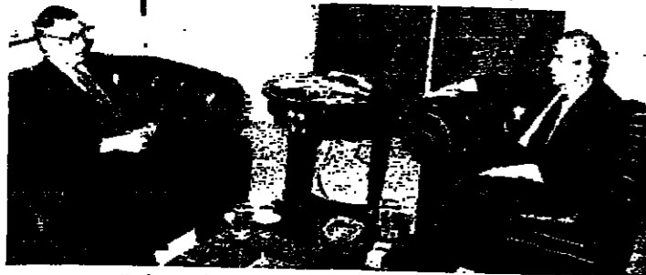
الهراوي والسفير غوتلمان (اليمين واليسار)